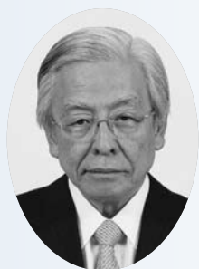
一般社団法人 企業研究会会長